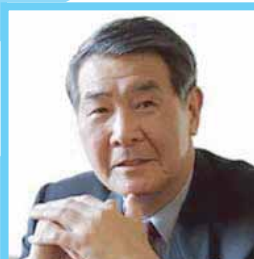
講師／岩井 國臣 氏 参議院議員 国土交通副大臣